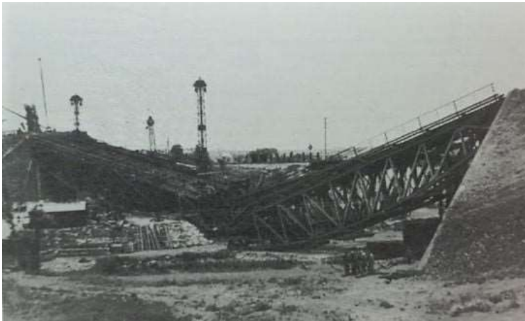
Le pont de chemin de fer sur la Seille à Magny dynamité par les allemands dans la nuit du 15 au 16 novembre pour retarder l'avancée des troupes américaines

Le 15 novembre : toutes les unités de la 5 o Division d'Infanterie US se regroupent pour préparer la pénétration dans Metz et remontent le long de la Seille obligeant ainsi l'artillerie allemande à se replier sur le Fort de Queuleu (Feste Goeben)