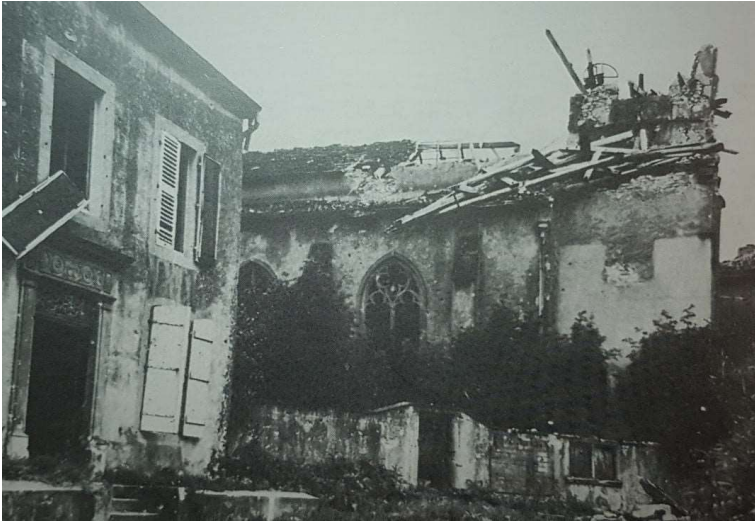
Eglise d'Augny bombardée