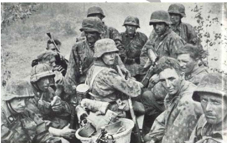
Soldats du 38 o PGR SS

Le vendredi 17 novembre : Le 38 o Panzer Grenadier Regiment SS abandonne la ligne de front, suite à l'attaque au Centre par les troupes US.